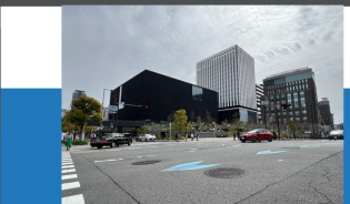
⑩田蓑橋南詰交差点