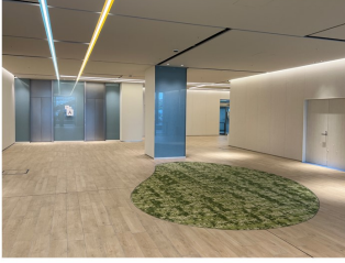
③ Nakanoshima Qrooss 1Fエントランス