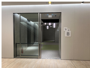
⑤ Nakanoshima Qrooss 1F Bエレベーター