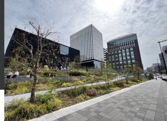
⑨大阪中之島美術館