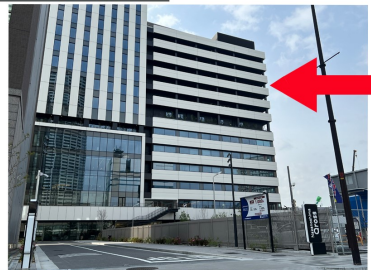
①桜橋渡辺未来医療病院