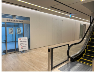
④ Nakanoshima Qrooss 1Fエスカレーター前