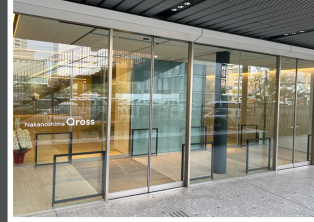
② Nakanoshima Qrooss 1F入口