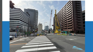
⑧玉江橋南詰交差点